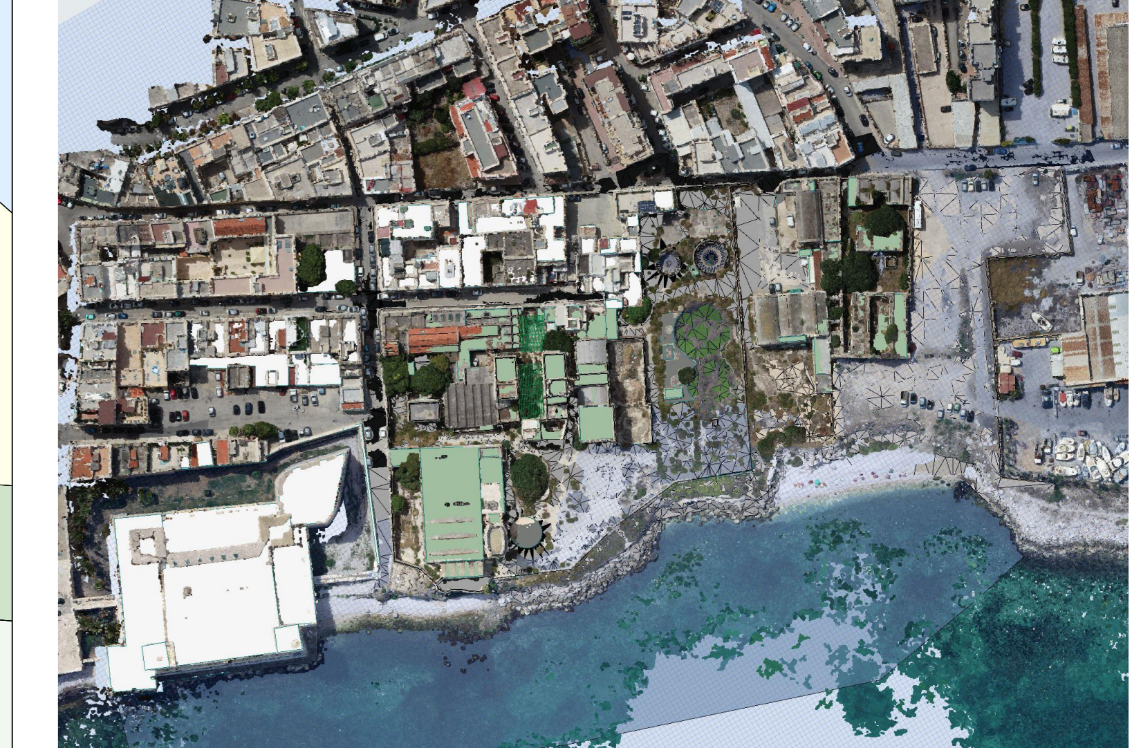
SOVRAPPOSIZIONE MODELLO BIM CON NUVOLE DI PUNTI - VISTA PROSPETTICA