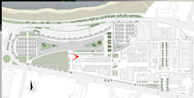
VISTA PORTICATO e PORTALE INGRESSO MODULO "A" _CAMPO DI INUMAZIONE