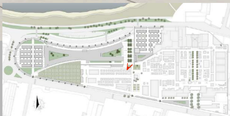
VISTA MURO DI CONNESSIONE CON L'ANTICO CIMITERO