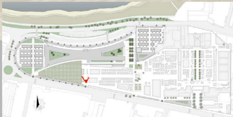
VISTA PORTALE INGRESSO MODULO "A"