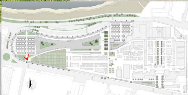
VISTA PORTICATO MODULO "CAPPELLE"