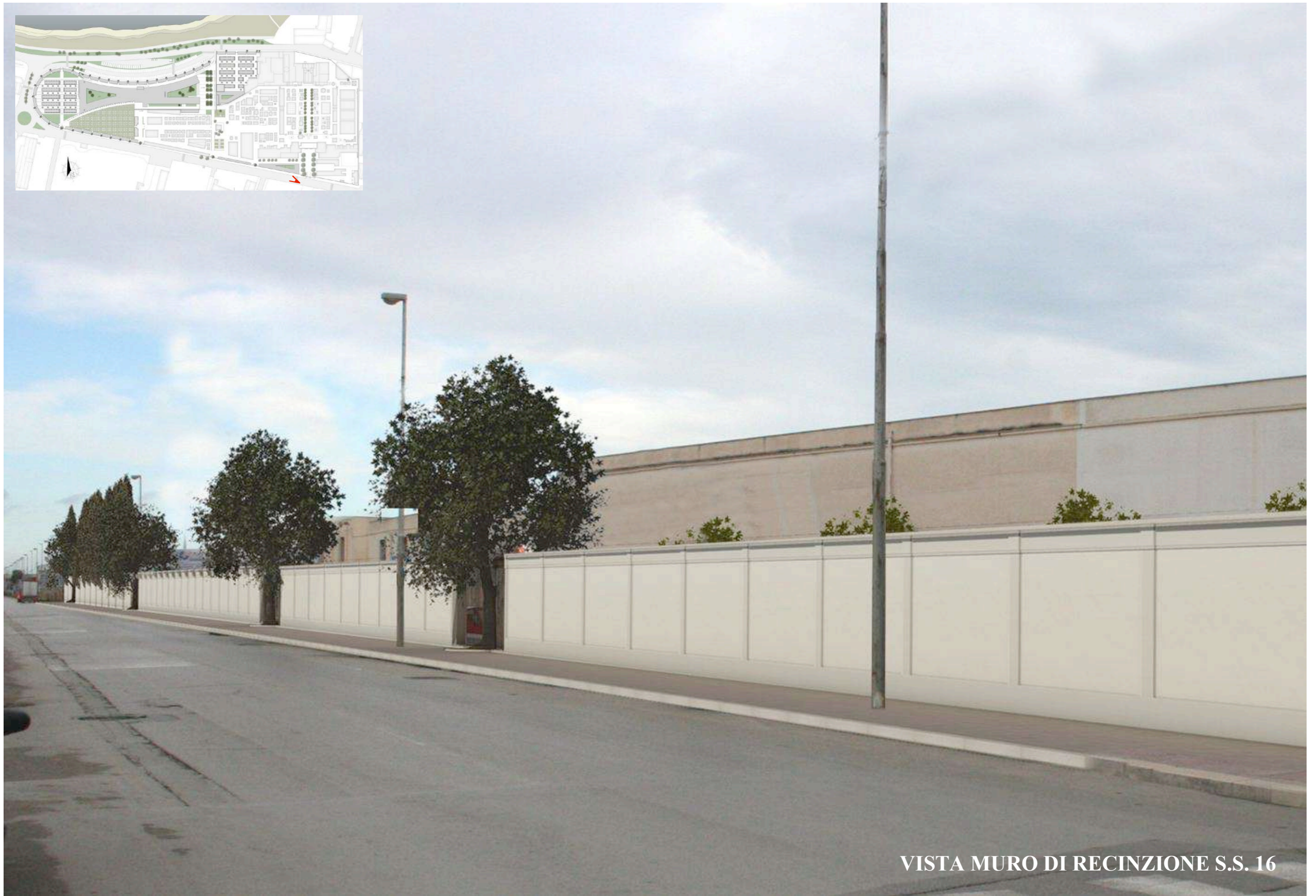
VISTA MURO DI RECINZIONE S.S. 16