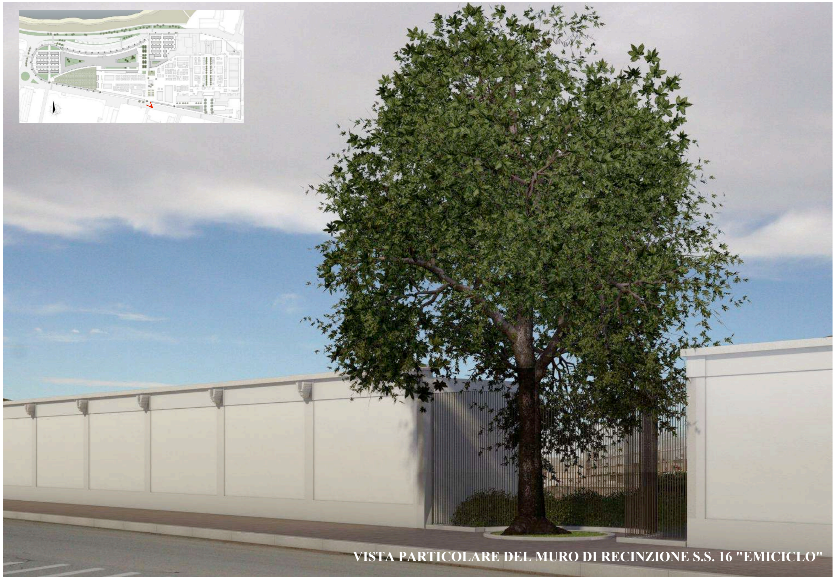
VISTA PARTICOLARE DEL MURO DI RECINZIONE S.S. 16 "EMICICLO"