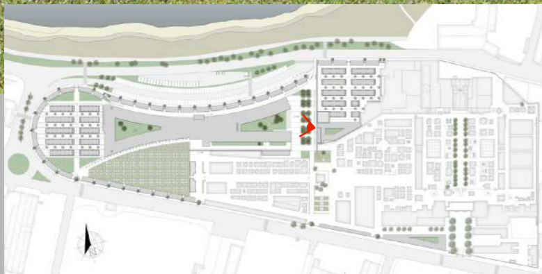
VISTA MODULO "A" ATRIO DI LEVANTE