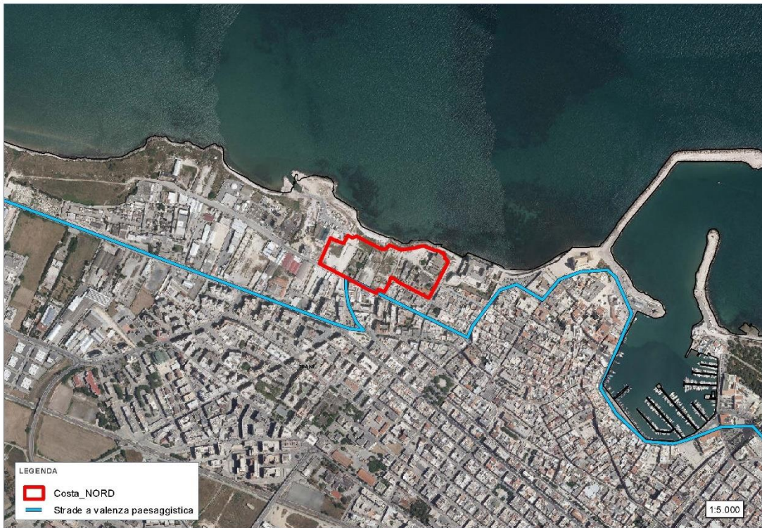
Figura 8: PPTR Componenti percettive