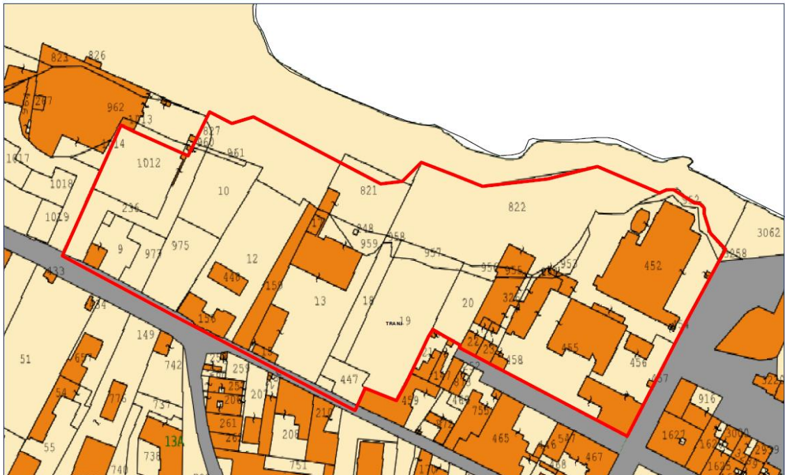
Figura 2 - Mappa Catastale

Le particelle interessate dal presente intervento ricadono tutte nel foglio 13 del comune di Trani e sono: 18; 20; 956; 958; 19; 22; 23; 326; 466; 447; 452; 454; 455; 456; 457; 458; 952; 953; 954; 955 e 957