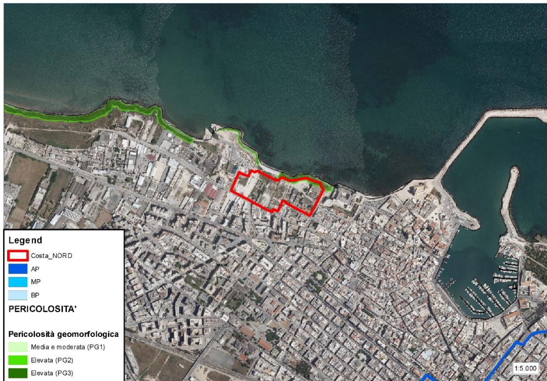
Figura 3: Inquadramento PAI