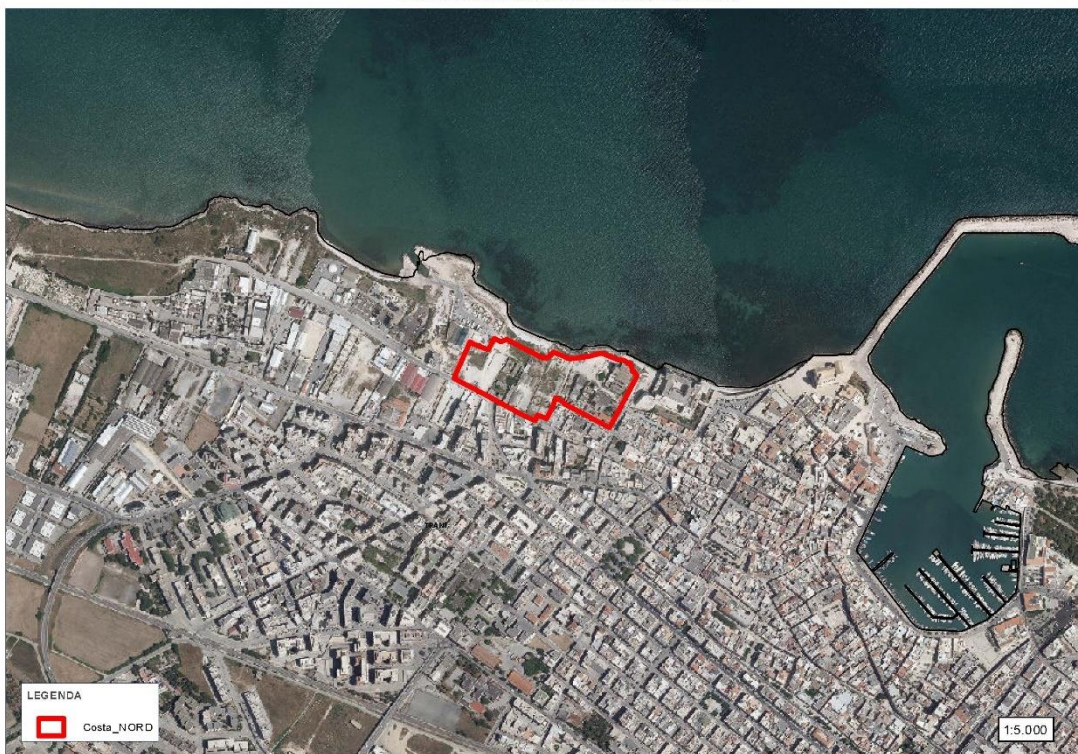
Figura 5: PPTR Componenti aree protette