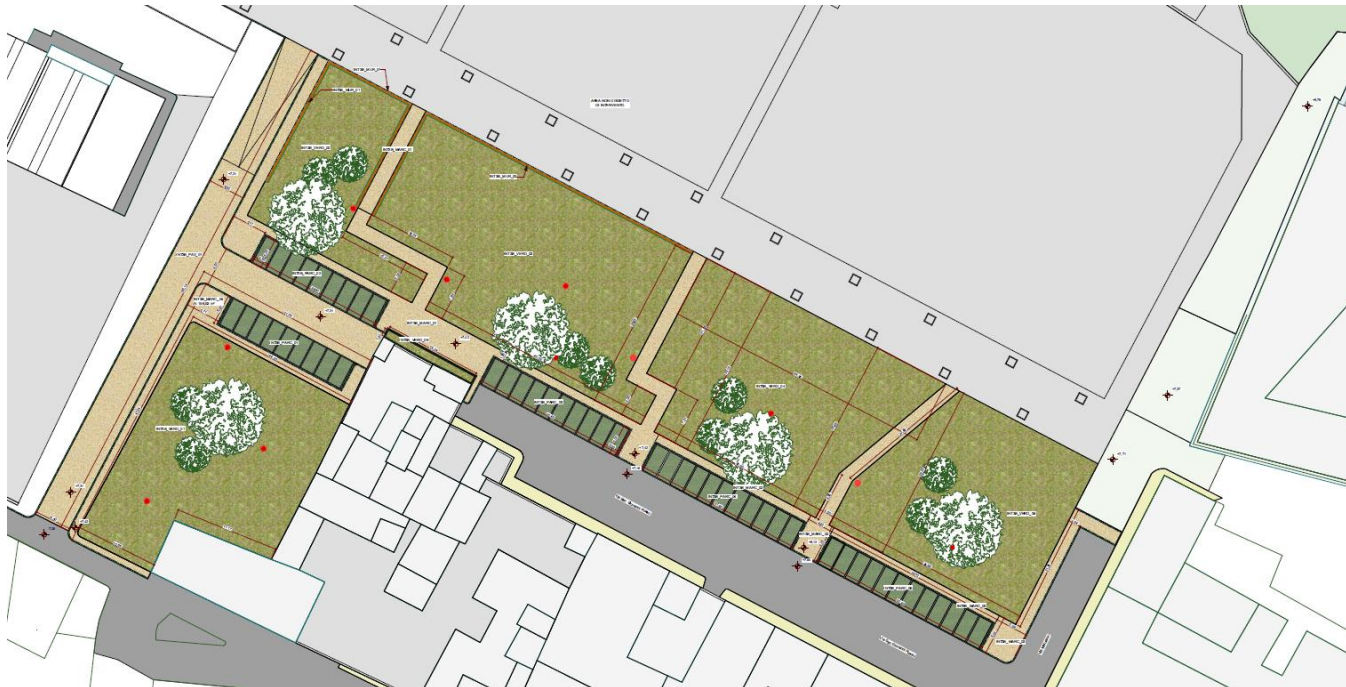
Figura 10: Planimetria di progetto

Il progetto prevede, inoltre, la realizzazione dell'impianto di pubblica illuminazione con armature Led, di ultima generazione ideali per l'illuminazione di parchi ed aree a verde.