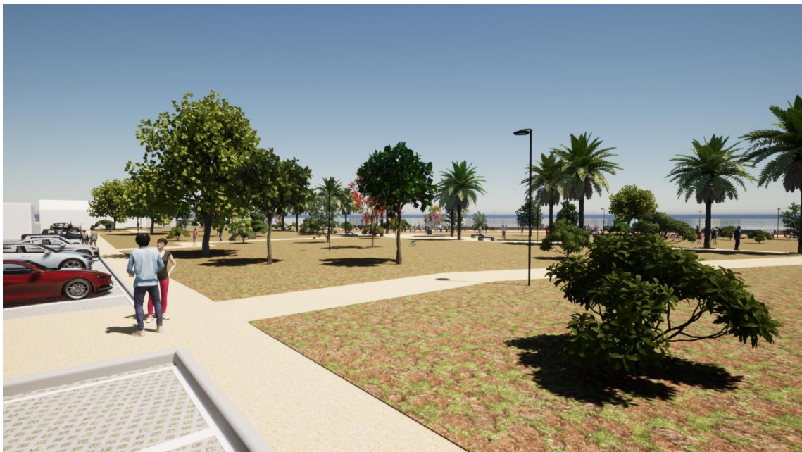
Figura 12: Foto inserimenti stato di progetto