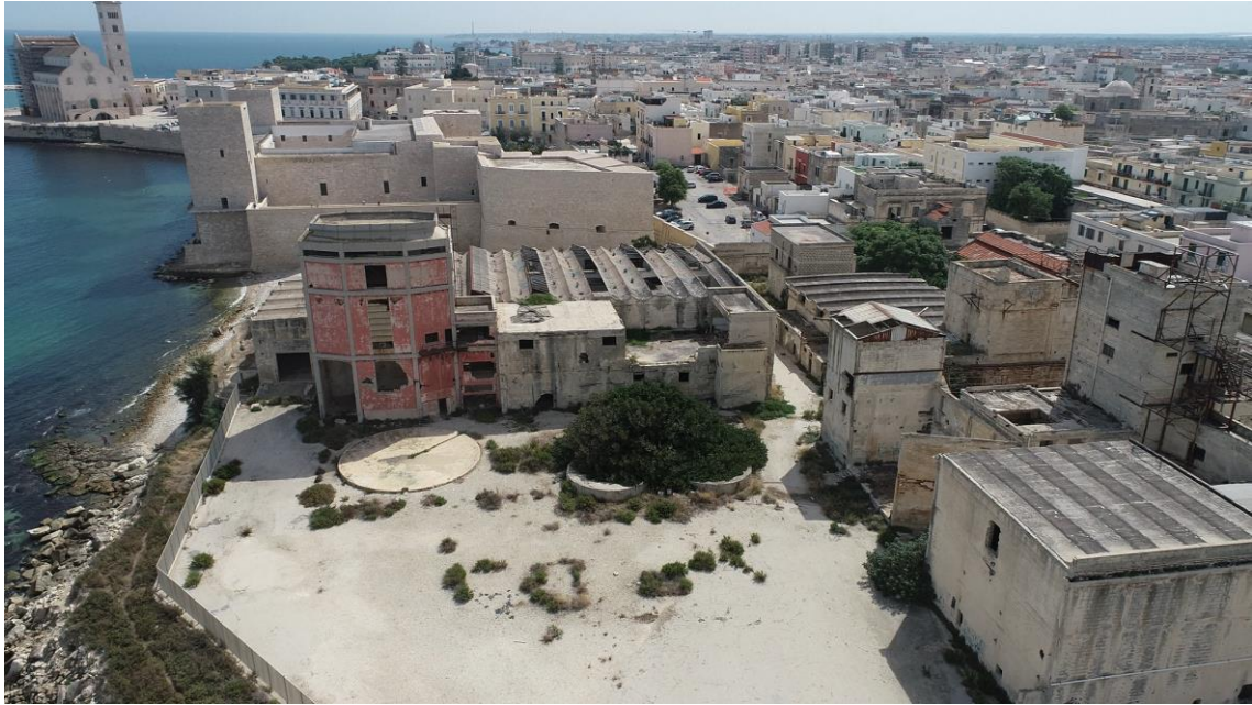
Figura 11: Area di intervento