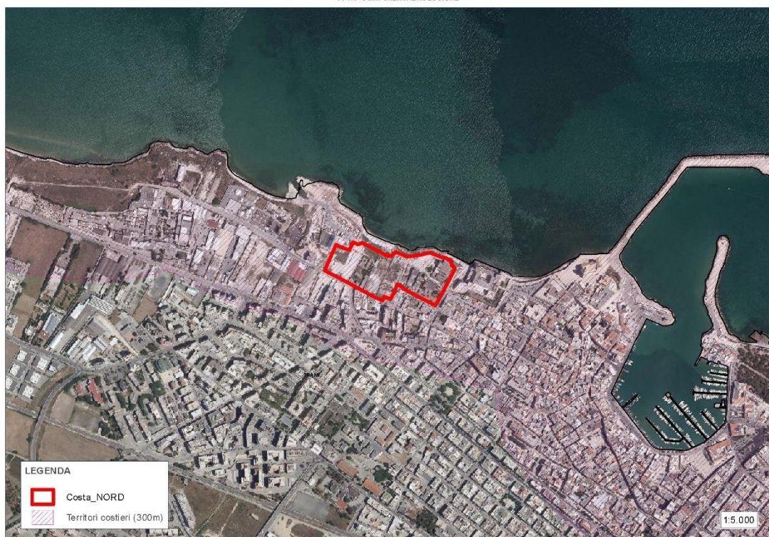
Figura 4: PPTR Componenti idrologiche