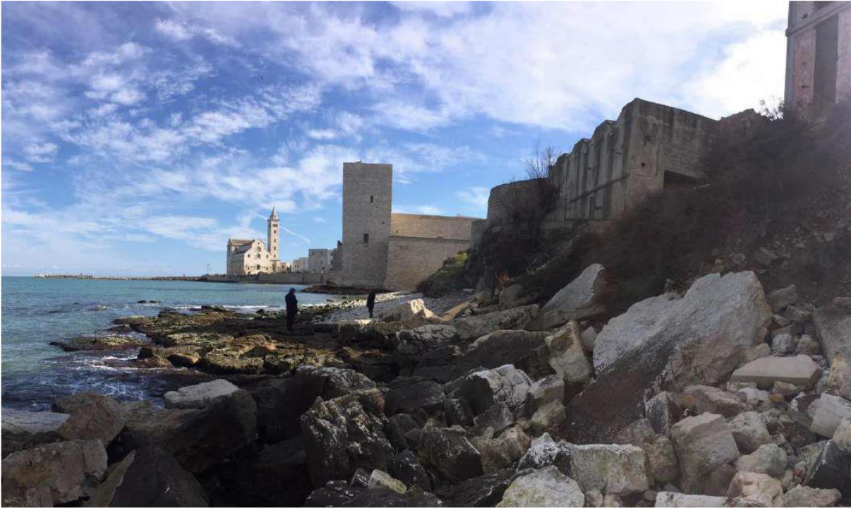
Stato di attuale degrado della costa.