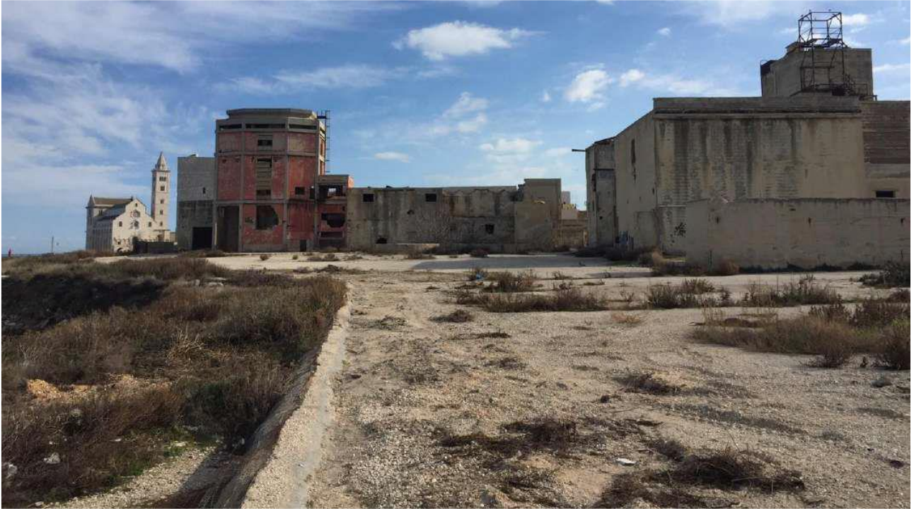
Area dell'ex Distilleria.