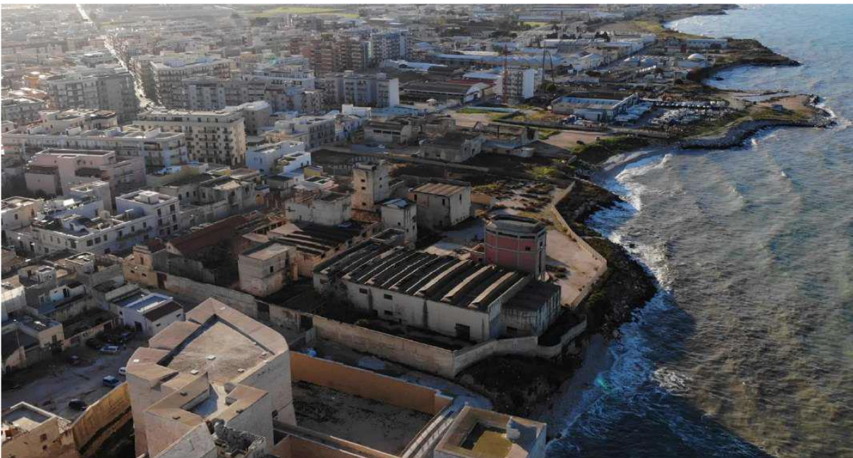
Vista dal Castello dell’ambito di intervento.