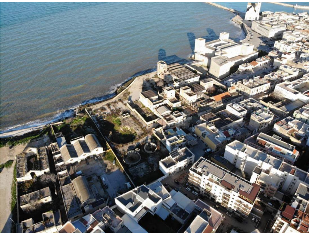
Foto area degli impianti industriali dismessi, nella loro attuale condizione di degrado e abbandono.